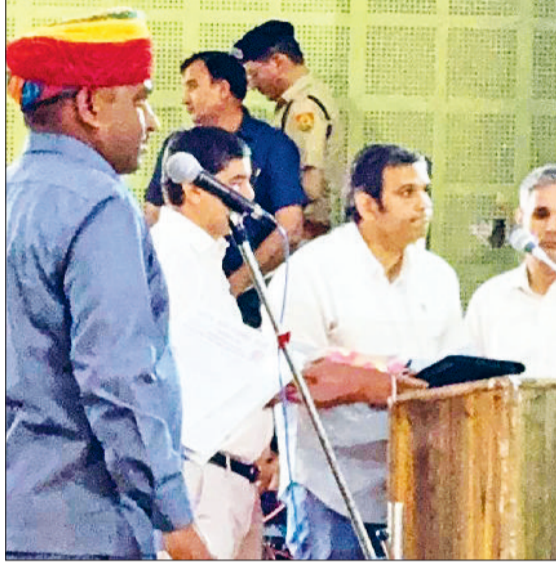
नारनौल। परिवर्तित की मौजूदगी में मंत्री के समक्ष अपना पक्ष रखते एक्सईएन।

गांव पाली के सरपंच की शिकायत है कि सरकार ने गांव में अभी स्ट्रीट लाइट लगाई है। उनकी हालत बहुत ही खराब है। इन लाइट्स में अभी लाइट खराब है। जो तार इनमें लगाए गए हैं, वह निम्न किस्म का है। जिससे हमेशा शाट सर्किट तथा टूटने का डर बना रहेगा। ये लाइटें कभी जलती हैं कभी नहीं। जिससे गांव में रात को अंधेरा छाया रहता है। इस विषय में कई बार ग्रीवेंस की बैठक में मुद्दा उठाया गया। सांसद चौधरी धर्मवीर सिंह को भी अवगत करवा चुके हैं। उन्होंने विजिलेंस जांच के लिए कहा था कि यह लाइटें पूरे जिले में खराब है। इसकी विजिलेंस जांच होनी चाहिए लेकिन अभी तक कोई भी कार्रवाई नहीं हुई है। सरपंच ने मांग करते हुए कहा कि जल्द से जल्द इसकी जांच कर तार तथा स्ट्रीट लाइट को बदले। जिससे गांव में रात के समय में रोशन हो सके। जब तक लाइट का काम पूरा ना हो, तब तक ठेकेदार की पेमेंट नहीं की जाए। इस शिकायत को ग्रीवेंस में 22 जनवरी को लगाया गया था। इसके बाद परिवर्तित और पंचायती राज गुरुग्राम के उप मंडल अभियंता को सुनने के बाद विभाग की कार्य प्रणाली में त्रुटि जाने पर ग्रीवेंस मीटिंग में मंत्री अरविंद शर्मा ने जिला विकास एवं पंचायत अधिकारी को आदेश देते हुए कहा था कि समस्त जिले की ग्राम पंचायतों में लगी लाइटों वाले सरपंच या आम व्यक्ति द्वारा इस तरह की शिकायत की जा रही है। ऐसे में परिवर्तित को शामिल जांच करके विस्तृत रिपोर्ट निदेशालय पंचायत व निदेशक आपूर्ति एवं निपटान हरियाणा को भेजते हुए इस कार्यालय को आगामी बैठक से यथासमय पूर्ण करवाएं।