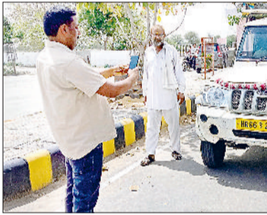
नारनौल। सरसों लेकर मंडी आए वाहन की फोटो खींचता कर्मचारी व क्यूटर पर अंगुठे से बायोमेट्रिक हाजिरी लगाता किसान।